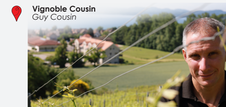
9 Vignoble Cousin Guy Cousin

Avec la participation de nos partenaires: