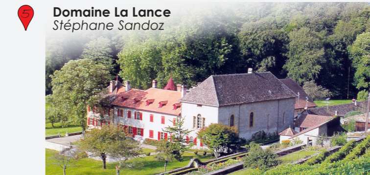
5 Domaine La Lance Stéphane Sandoz